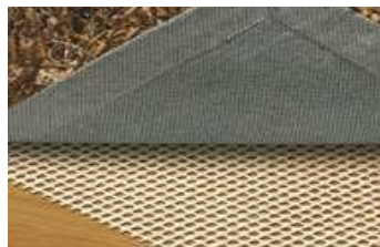
Besorgen Sie sich im Fachgeschäft eine sichere Unterlage für Teppiche und Läufer oder entfernen sie sie ganz.