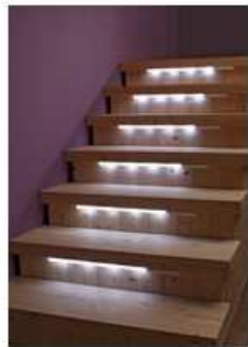
LED-Treppenbeleuchtung leicht installierbar, Stromsparend