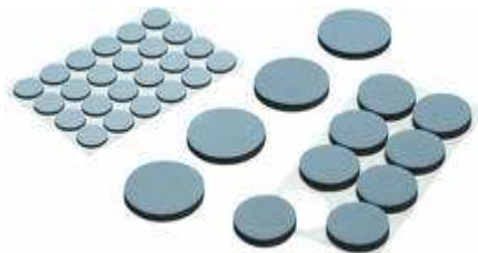
Oft ist der Platz zwischen den Möbeln schlichtweg zu eng. Schaffen Sie Platz für die "Wege" in Ihrer Wohnung