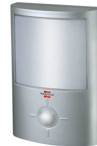
Nachtbeleuchtung mit Bewegungsmelder:

Beim nächtlichen Gang zur Toilette können Bewegungsmelder gute Dienste tun und den Weg problemlos weisen