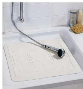
Die Duschatte unterstützt einen sicheren, rutschfesten Stand im Duschbecken.