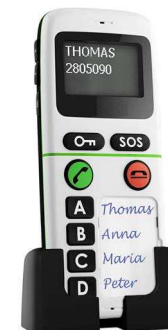
Mit einem Notruftelefon können Sie jederzeit Ihre Familie, Freunde oder Nachbarn rufen. Sie können beliebige Rufnummern einprogrammieren.