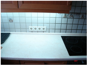
Unterschrankbeleuchtung mit Leuchtröhren